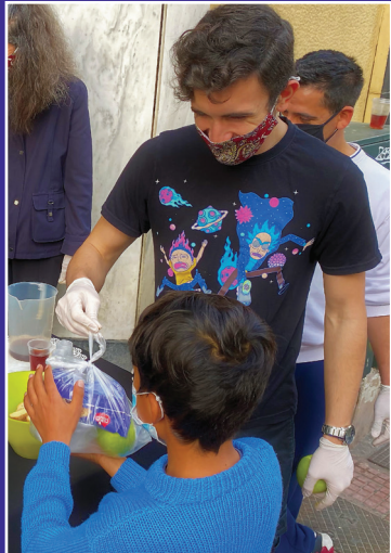
Προσφορά φαγητού στον μικρό φίλο από το Ιράν

Με τους περισσότερους γνωριζόμαστε καιρό και ο Θεός εργάζεται μέσα τους! Πάντα μας ευχαριστούν και μας λένε πόσο τους αρέσουν τα φαγητά μας!