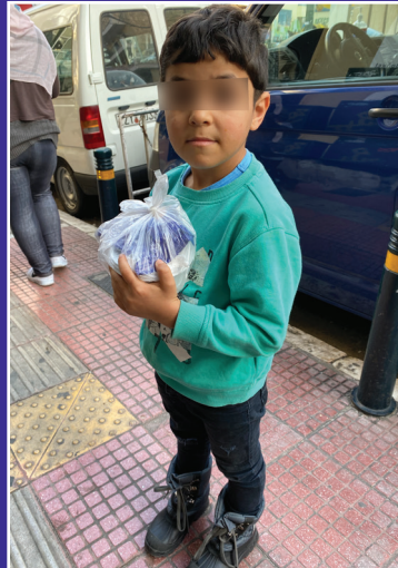
Ένας άλλος μικρός φίλος που παίρνει φαγητό!