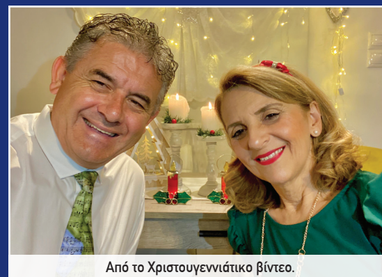
Από το Χριστουγεννιάτικο βίντεο.