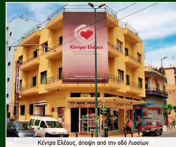
Κέντρο Ελέους, άποψη από την οδό Λιοσίων

Είναι αυτό που χρειάζεται κάθε μεγάλη πόλη της χώρας! Έναν τόπο ελπίδας και ελπίδας όπου άνθρωποι βρίσκουν φαγητό, ρούχα, σκεπάσματα, ψυχολογική στήριξη, απεξάρτηση, ψυχαγωγία, μαθητεία, συμπόνοια και ποιμανση! Στην αρχή θα ξεκινήσουν Ομάδες Δράσης, όπως στην Κρήτη και θα εξελιχθούν σε Κέντρα Ελέους! Παρακαλούμε ΠΡΟΣΕΥΧΕΣΘΕ!