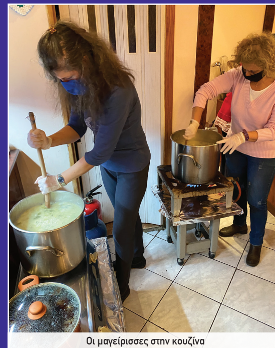
Οι μαγείρισσες στην κουζίνα

Κάθε Τρίτη, Πέμπτη και Σάββατο μαζευόμαστε από τις 5:00 το απόγευμα για να μαγειρέψουμε και να προετοιμαστούμε και στις 7:00 το βράδυ προσφέρουμε το φαγητό.