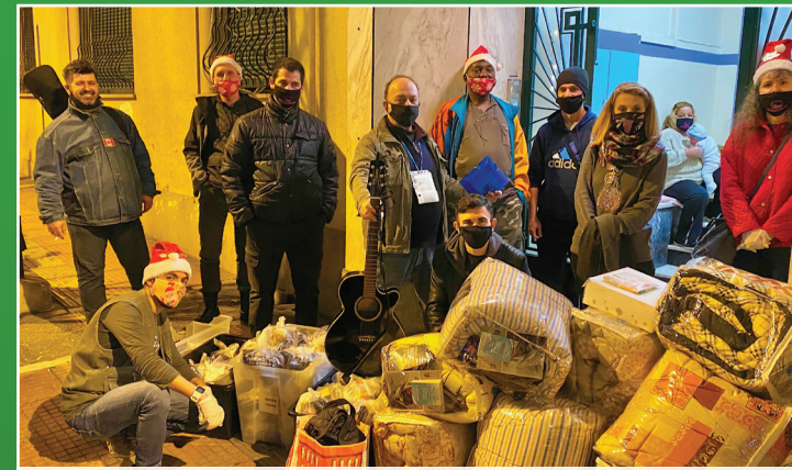
Οι Κομάντος του Ελέους έτοιμοι να εξορμήσουν με πολλά "πολεμοφόδια", φαγητά και Τσάντες Αγάπης!

Κάθε Πέμπτη, αφού προσφέρουμε φαγητό στην είσοδο του Κέντρου Ελέους, μετά έχουμε την Εξόρμηση Ελέους! Προσφέρουμε το φαγητό και τις Τσάντες Αγάπης στην πλατεία Βάθη, στην Ομόνοια, στο Μεταξουργείο, κυρίως σε εξαρτημένους "φίλους μας"! Από τις 7:30 ως τις 8:30 συμμετέχουμε σ'αυτή την Εξόρμηση περίπου 10-12 "Κομάντος Ελέους"!