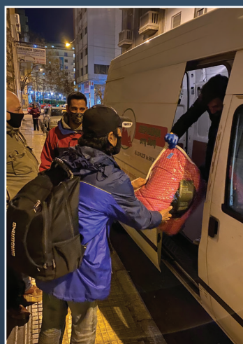
Οι Κομάντος του Ελέους προσφέρουν Τσάντες Αγάπης σε άστεγο!