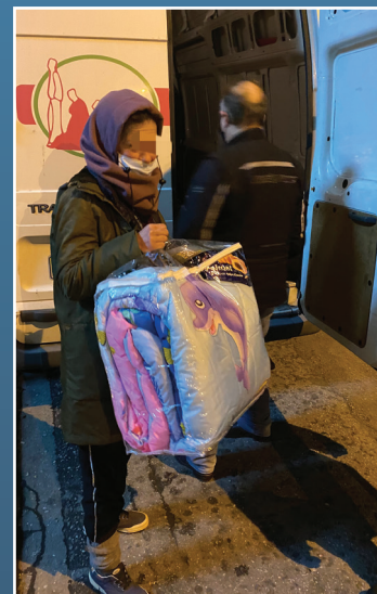
Τσάντα Αγάπης σε άστεγη εξαρτημένη!