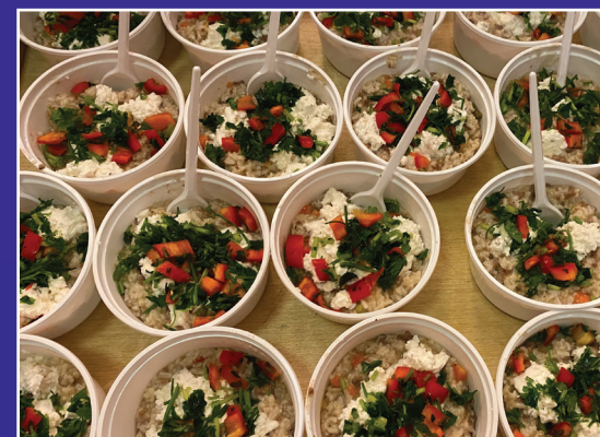
Για το φαγητό μας δίνουν πάντα συχαρητήρια