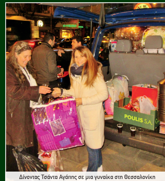
Δίνοντας Τσάντα Αγάπης σε μια γυναίκα στη Θεσσαλονίκη

Τι σημαίνει αυτό; Λοιπόν σκεφτείτε 2-3 τροχόσπιτα που μεταφέρουν 10 άτομα βασικό προσωπικό. Ένα μεγάλο φορτηγό φέρνει όλο τον εξοπλισμό, διατροφές, ηχητικά, έντυπα κ.λ.π. κι ένα ακόμα φορτηγό που μεταφέρει είδη πρώτης ανάγκης: τρόφιμα, σκεπάσματα, φάρμακα, νερά, ρούχα, παιχνίδια κ.λ.π. Παραδείγματος χάριν λοιπόν, ξεκινά τον Απρίλιο αυτό το Καραβάνι από την Αλεξανδρούπολη και πηγαίνει σε διάφορες πόλεις και τελειώνει στη Λάρισα τον Οκτώβριο! Την επόμενη χρονιά το καραβάνι πηγαίνει στη νότια Ελλάδα.