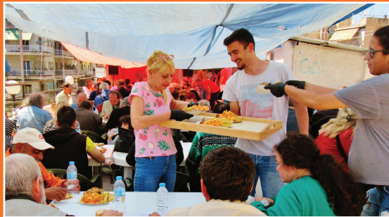
Σερβίροντας φαγητό Δευτέρα του Πάσχα στην ταράτσα μας πριν μερικά χρόνια!

Πού είναι εκείνες οι όμορφες μέρες που μπορούσαμε να συγκεντρωνόμαστε χωρίς κανένα πρόβλημα! Είχαμε ζήσει πολύ ευλογημένες μέρες και συγκεντρώσεις στη μεγάλη ταράτσα μας υπηρετώντας δεκάδες φίλους μας!