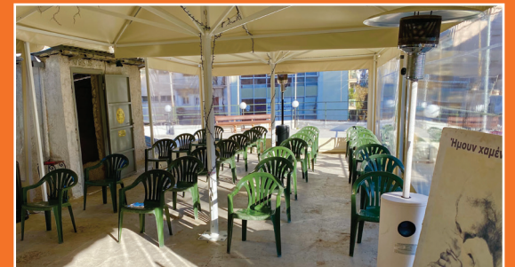
Η σκεπασμένη όμορφη ταράτσα μας, έτοιμη να υποδεχθεί τον κόσμο!