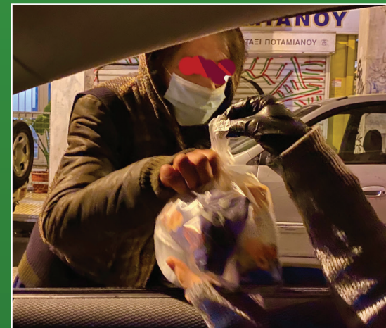
Προσφορά φαγητού στο δρόμο σε εξαρτημένους!

Κάθε Πέμπτη, αφού προσφέρουμε φαγητό στην είσοδο του Κέντρου Ελέους, μετά έχουμε την Εξόρμηση Ελέους! Προσφέρουμε το φαγητό και τις Τσάντες Αγάπης στην πλατεία Βάθη, στην Ομόνοια, στο Μεταξουργείο, κυρίως σε εξαρτημένους "φίλους μας"! Από τις 7:30 ως τις 8:30 συμμετέχουμε σ'αυτή την Εξόρμηση περίπου 10-12 "Κομάντος Ελέους"!