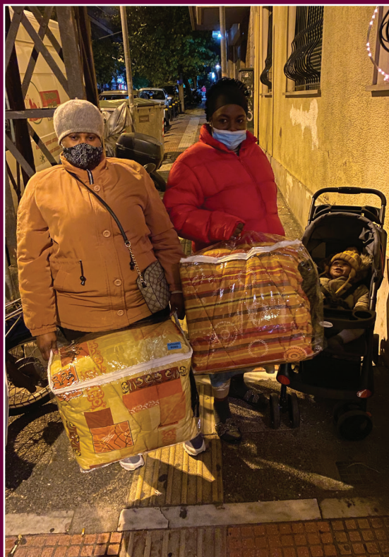
Κυρίες από την Γκάνα που χρειάζονταν σκεπάσματα!

Γνωρίζατε ότι αυτό το όμορφο τριώροφο κτίριο όπου στεγάζεται το Κέντρο Ελέους έχει ένα ασφάλινο μεγάλο υπόγειο το οποίο ήταν καταφύγιο για τις οικογένειες που ζούσαν σ' αυτό και για τους γείτονες από τους βομβαρδισμούς των Γερμανών το 1940; Το ασφάλινο αυτό υπόγειο είναι σφραγισμένο και δεν χρησιμοποιείται εδώ και πολλά χρόνια! Το 2007 ο Κύριος με θαυμαστό τρόπο μας οδήγησε να το νοικιάσουμε για να γίνει η βάση των δράσεων Ελέους που επιχειρούμε στο Κέντρο της Αθήνας! Από τότε αρκετοί άνθρωποι, εξαρτημένοι, άστεγοι και πρόσφυγες που φιλοξενήσαμε στο κτίριο, βρήκαν εκεί καταφύγιο. Άλλοι έμειναν λίγο κι άλλοι περισσότερο, κάποιιοι έμειναν 2,5 χρόνια στο Πρόγραμμα Απεξάρτησης για να νικήσουν τα ναρκωτικά και βγήκαν καινούργιοι άνθρωποι κι άλλοι πρόσφυγες έμειναν 4 χρόνια για να μπορέσουν να κάνουν οικονομία και να φτιάξουν τη ζωή τους! Το σπουδαίο είναι ότι από το 2007, δεκάδες άνθρωποι κατέφυγαν στο κτίριο αυτό για να προστατευθούν όπως κατέφυγαν και δεκάδες άνθρωποι το 1940 για να προστατευθούν από τους βομβαρδισμούς!