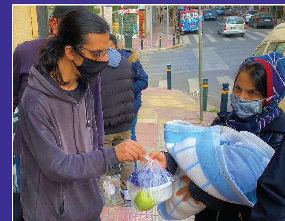
Προσφορά φαγητού σε νεαρή πρόσφατα μητέρα στην είσοδο του Κέντρου Ελέους!

Οι φίλοι μας, εξαρτημένοι, άστεγοι, πρόσφυγες και άλλοι που βρίσκονται σε ανάγκη, έρχονται μέχρι και τις 8:00 να πάρουν το φαγητό! Και την Κυριακή το πρωί είμαστε εκεί από τις 11:00 έως τις 2:00μμ.