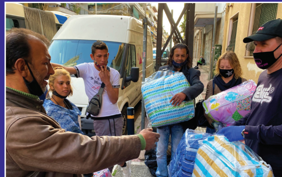
Τσάντες Αγάπης που προσφέρονται σε άτομα που είναι σε ανάγκη!