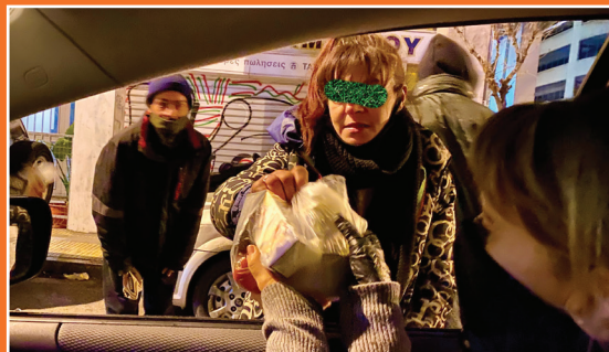
Προσφορά φαγητού στον δρόμο