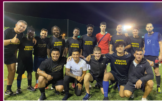
Η θρυλική ομάδα του Κέντρου Ελέους.