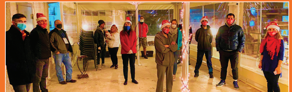
Κομάντος Ελέους στην σκεπασμένη μας ταράτσα!