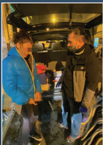
Νεαρός άστεγος δοκιμάζει το μπουφάν που του προσφέραμε

Με αρκετούς ήλεμε περισσότερα πράγματα και με κάποιους προσευχόμαστε καθώς τους προτείνουμε να καλέσουν τον Ιησού Χριστό στη ζωή τους! Δόξα στον Θεό, ακόμα και μέσα στα πιο σκληρά μέτρα, δεν έχουμε ποτέ πρόβλημα με ελέγχους από την Αστυνομία και σκεφτόμαστε ότι ή τους είμαστε πλέον πολύ γνωστοί ή περνάμε απαρατήρητοι, σαν αόρατοι as πούμε...!