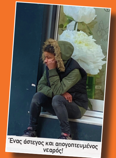
Ένας άστεγος και απογοητευμένος νεαρός!

ΜΠΟΡΕΙΤΕ να ΣΥΜΜΕΤΕΧΕΤΕ για να συγκεντρώσουμε τα 3.000 ευρώ που χρειαζόμαστε για τις δράσεις της Μεγάλης Εβδομάδας! ΔΕΙΤΕ τις πληροφορίες στις σελίδες 15 & 16