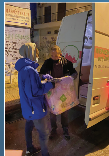
Τσάντα Αγάπης σε άστεγο πρόσφυγα!