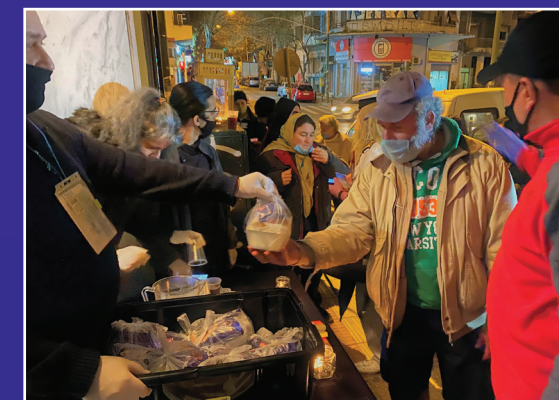
Προσφορά φαγητού στην είσοδο του Κέντρου Ελέους!